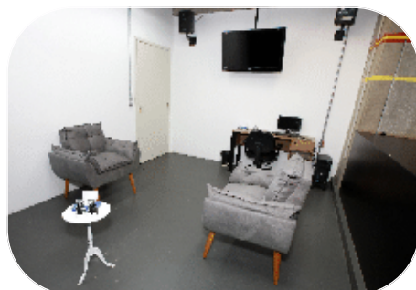
✦ Acima e abaixo as novas instalações do NAEP