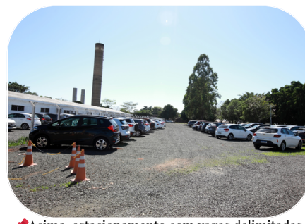
✦ Acima, estacionamento com vagas delimitadas. Abaixo, o bicicletário, que fica no estacionamento dos professores.