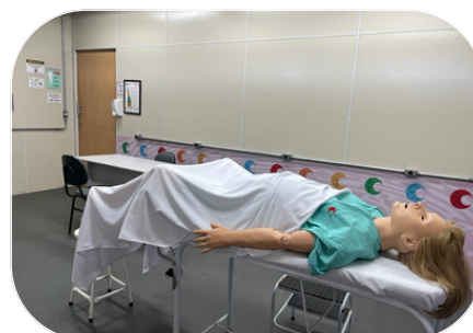
✦ Laboratório de habilidades médicas com nova estrutura de simulação de atendimento ao paciente.

A preocupação também se estende aos locais nos quais são desempenhadas as simulações e desenvolvimento das habilidades médicas, com instalação de painel adesivo e melhor apresentação do material que utilizaremos ao longo da graduação, permitindo mais semelhança com os cenários de atendimento e humanização do