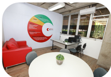
✦ Sala de atendimento ao discente, localizada bem ao lado da Secretaria

Alguns ambientes foram criados e outros modificados, para permitir melhor sensação de receptividade e aconchego aos alunos. É o caso dos locais cujas fotos estampam nossa página desta edição.