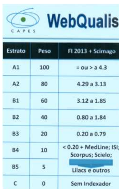
Tabela 3 – Classificação qualis capes para revistas não classificada na plataforma sucupira.

http://qualis.capes.gov.br/webqualis/ConsultaListaCompletaPeriodicos.faces *Clicar em Lista Completa => Periódico => Medicina I => Gerar Relatório Completo, e uma planilha listando o Título da revista com a classificação da CAPES (se A1, A2, B1, B2,...C). Caso o periódico não conste na lista da CAPES, considerar a classificação apresentada na a seguir (FI – Fator de Impacto) ou tabela da CAPES geral 2019